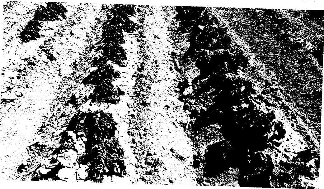
PATATE - Loc. FRASSITELLI