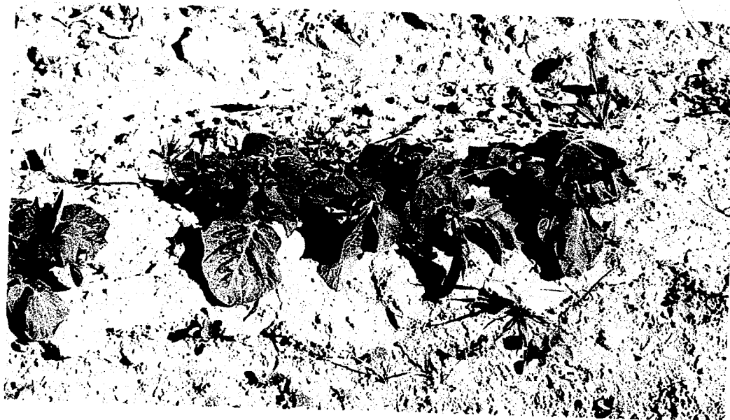
PATATE - Loc. MONTESANTO