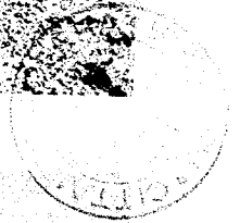
PATATE - Loc. Candelara