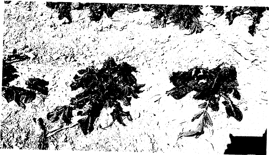
PATATE - Loc.SAGLIANO