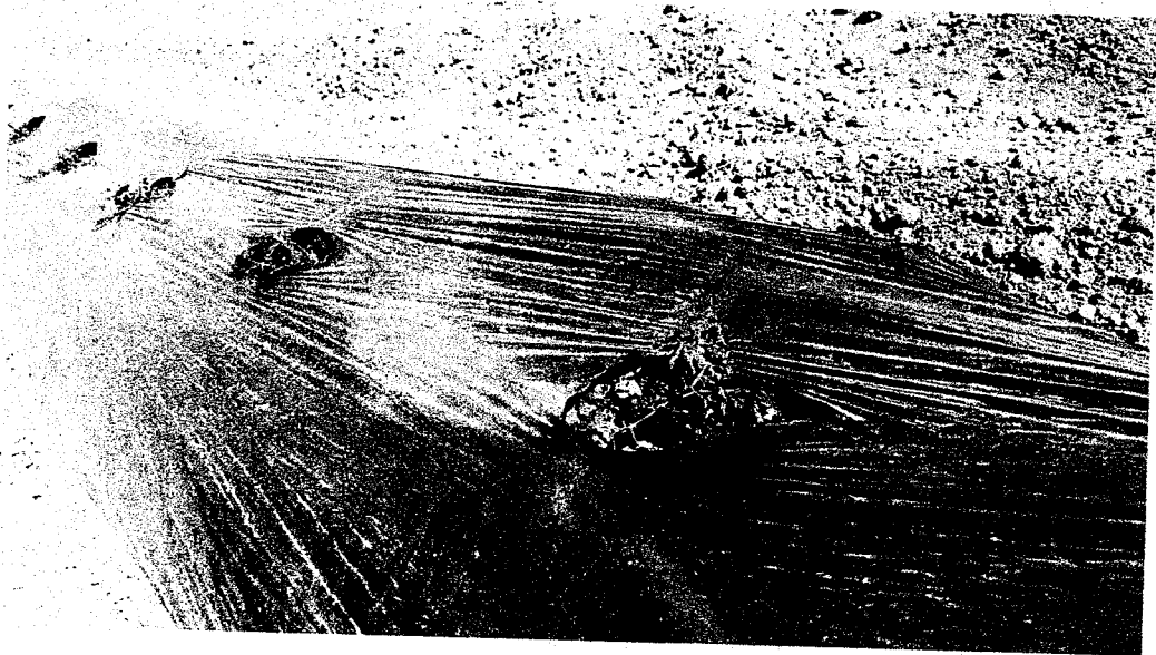
POMODORI - Loc. CANDELARA