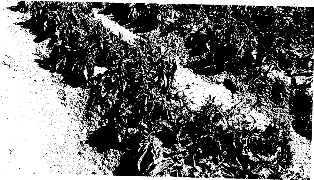
PATATE - Loc. CALABRICITO